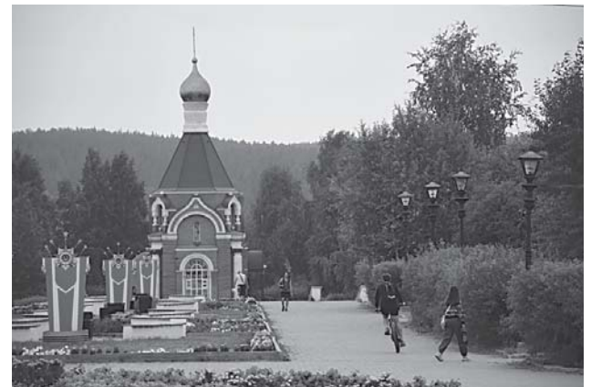
Малый храм Иоанна Богослова — символ единения всех поколений заводчан

нововведения на научной основе, привлекая в качестве консультантов специалистов из профильных министерств и академий.